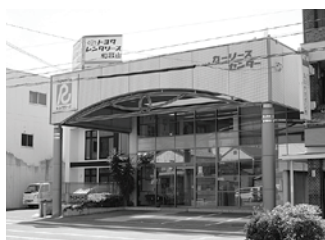
トヨタレンタリース和歌山 本社