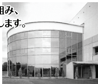
風景に溶け込むエントランスが特徴的な事務所棟