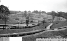
パークゴルフ場測量設計