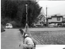
GNS S 測量