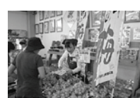
店頭でPRする 「梅宣伝隊」