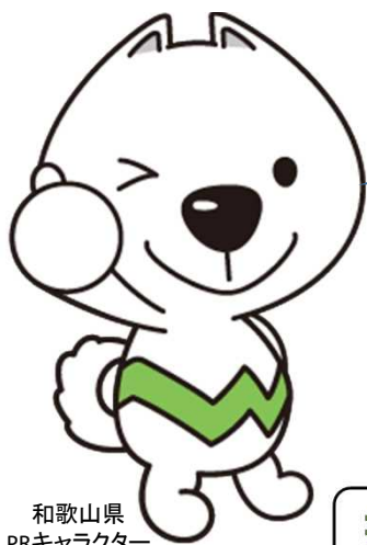
和歌山県 PRキャラクター 「きいちゃん」